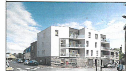
Appartement 01 - RDC - Type 3