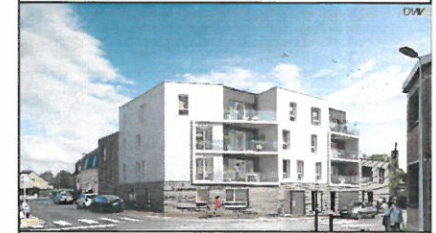
Appartement 11 - R+1 - Type 2