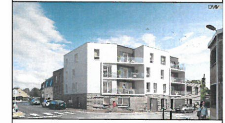
Appartement 12 - R+1 - Type 3