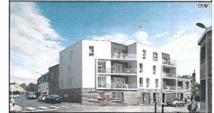
Appartement 13 - R+1 - Type 3