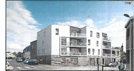
Appartement 22 - R+2 - Type 3