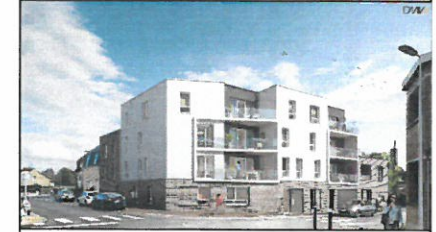
Appartement 23 - R+2 - Type 3