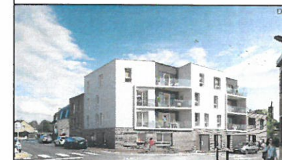
Appartement 32 - R+3 - Type 3